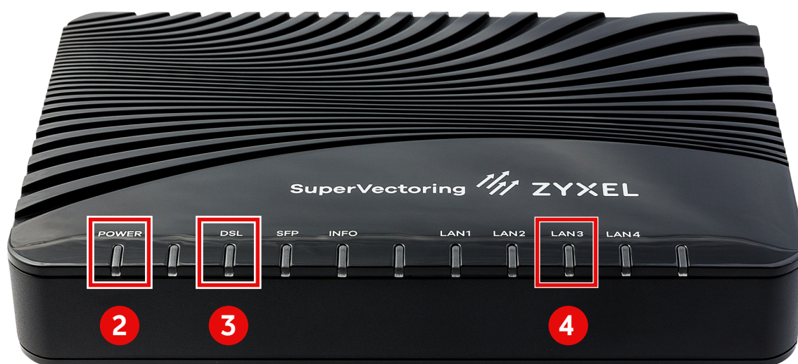
LED POWER , DSL und LAN3 am DSL-Modem ZyXEL VMG 3006